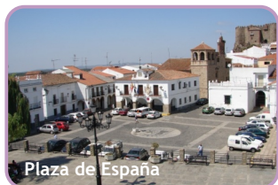
Plaza de España