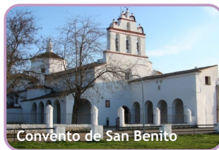
Convento de San Benito