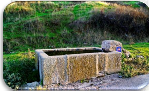
Fuente El Caño

Dotada de torre pequeña de agua de un solo caño y único pilar. Se ubica a los pies de la cuesta de su nombre.