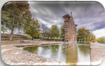
Fuente de la Carriona