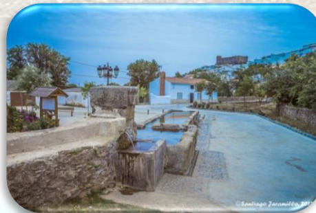
Fuente de La Alcantarilla

Situada en la carretera de Fuentes de León, solo quedan sus restos. Constaba de un solo caño y pilar.